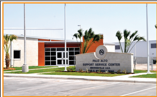
El Centro de Apoyo de Servicio Palo Alto

Esc. Preparatorias - 8:50 AM-4:00 PM | Esc. Secundarias - 7:40 AM-2:50 PM | Esc. Primarias - 8:15 AM-3:15 PM